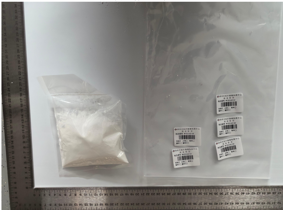
图 2 样品照片 2